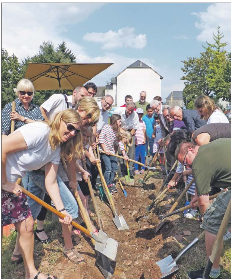
Alle packen an. Dieses Motto bewährte sich 2014 beim Spatenstich für das Wohnbauprojekt in der Thyrsusstraße 22-24 wie auch in der gesamten Sozialen Stadt Trier-Nord in den letzten 15 Jahren.