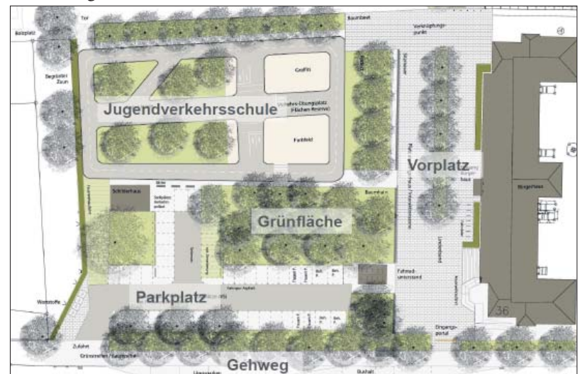
Aufgeräumt. Flächenaufteilung im Planvorentwurf für die Freiraumgestaltung zwischen Bürgerhaus und Ambrosius-Grundschule. Abbildung: BGHplan

vicestützpunkt Hilfe. Es handelt sich jedoch nicht um eine ambulant betreute Wohngemeinschaft. Alle Bewohner sind unmittelbar Mitglieder der Genossenschaft und erhalten durch die Zahlung von Genossenschaftsanteilen ein lebenslanges Wohnrecht mit bezahlbaren Mieten. Schließlich soll das Wohnumfeld in der Franz-Georg-Straße und anderen Straßenzügen des Quartiers mit einem Grünkonzept verbessert werden.