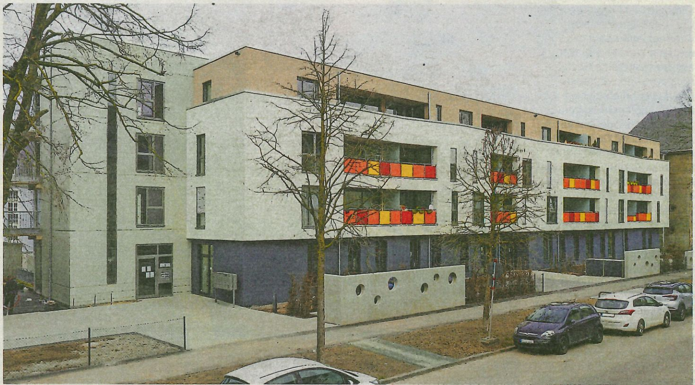
Wohnanlage in Trier-Nord mit einem Mix aus geförderten und frei finanzierten Wohnungen von Lamberty Architekten GmbH, Trier.